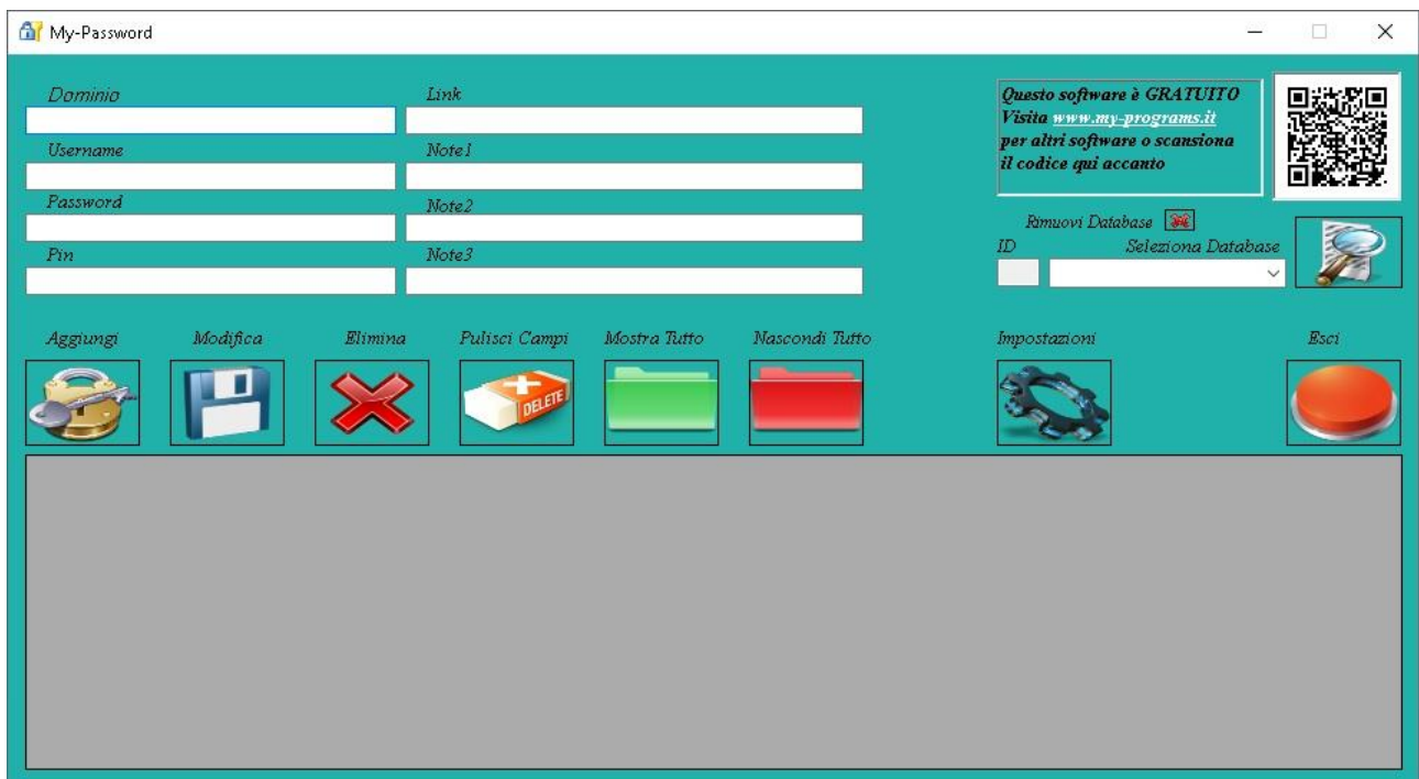
Fig. 2 Home

Dopo aver effettuato l'accesso, si avrà direttamente accesso alla schermata Home che si presenta come da figura seguente (Fig. 2)