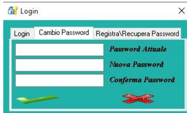
Fig. 1.3 Cambio Password

In caso si abbia la necessità di cambiare la password, andare nell'apposita sezione sempre nella schermata di Login come da immagine seguente (Fig. 1.3)