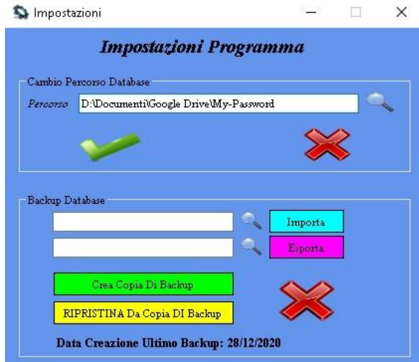
Fig. 3 impostazioni

In questa sezione è possibile effettuare diverse operazioni (fig.3)