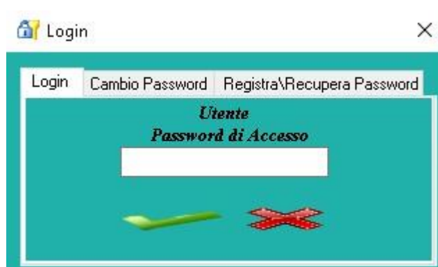
Fig. 1 Login

La schermata di primo avvio si presenta così (Fig.1)